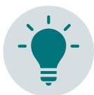
Innovation und Technologien

Die Clusterarbeit strukturiert sich dabei künftig entlang von sieben Schwerpunkten, die branchenübergreifend bearbeitet werden und das gemeinsame Fundament für die Zusammenarbeit der beteiligten Akteure bilden. Die Schwerpunkte sind so ausgerichtet, dass sie zur Umsetzung der Schwerpunkte aus der innoBB 2025 beitragen.