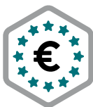
Führender europäischer Standort für Venture Capital