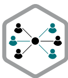
Beste Vernetzung einer breiten Akteurslandschaft