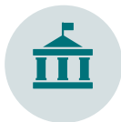
Hauptstadt. Modell. Regionen.