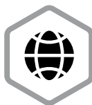
Attraktiv für Fachkräfte aus aller Welt