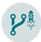
Ausgründungen und Startups