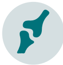
Orthopädie und Endoprothetik