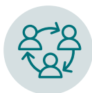
Vernetzung und Transfer