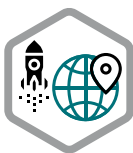
Top-Standort für Startups