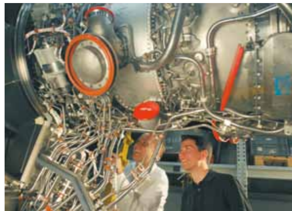
BTU Cottbus und Rolls Royce kooperieren intensiv bei der Entwicklung innovativer Triebwerkstechnologien. Studierende sammeln schon während des Studiums wertvolle Praxiserfahrungen am RR-Standort Dahlewitz

Die BTU Cottbus schneidet bei Hochschulrankings regelmäßig hervorragend ab. Hier insbesondere in den Studiengängen Wirtschaftsingenieurwesen und Architektur, aber auch Maschinenbau und Elektrotechnik.