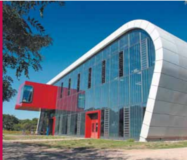
Das Interdisziplinäre Forschungszentrum für Leichtbauwerkstoffe (Panta Rhei gGmbH)